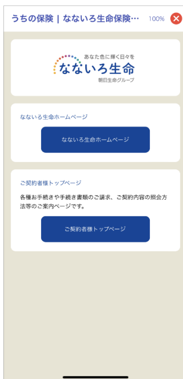
【なないろ生命保険株式会社】